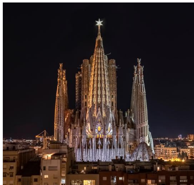
Foto: Sagrada Família

V Tarragoně jsme byli 5 dní a chodili jsme na pláže a různě se procházeli po městě. Když jsme šli poprvé na pláž tak jsme nevěděli, na kterou jdeme a hned vedle té pláže byla nuda pláž, takže jsme se smáli přes celý moře, víme proč ☺. Po 5 dnech jsme jeli zpátky do Barcelony a byli tam zase 5 dní tam jsme zas chodili po památkách a ochutnávali různá jídla a nakupovali na místních trzích. Jejich památky jsou překrásné a osobně doporučuju Vítězný Oblouk a Sagrada Família. V Barceloně jsme se seznámili s tátovým starým kamarádem se kterým jel studovat sem do Španělska a jeho kamarád se už nevrátil zpátky a založil si rodinu. Nejlepší vždycky bylo, když jsme si objednávali jídlo, táta na ně něco mluvil španělsky něco anglicky, a i něco česky, a pak ho odhadovali na Němce nebo Francouze, takže bomba. Kluci staří od 15-17 tak vypadali úplně stejně, stejné vlasy jak barva i styl, výška, styl oblečení, prostě jsem si myslela že na náměstí je jedna velká španělská rodina. (Ti kluci byli hot ☺)